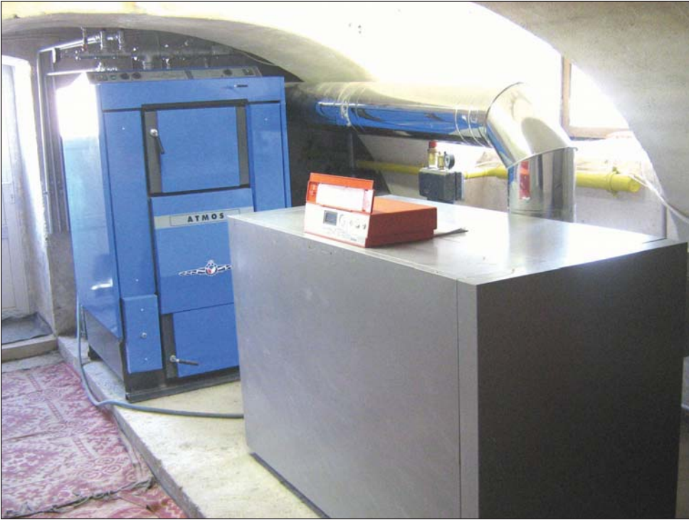
Reluarea cursurilor în 2007 Generala "Samuil Micu" din călduroase și apă caldă la a însemnat pentru elevii Școlii Sadu săli de clasă mai grupurile sociale. Începute în

luna octombrie a anului trecut, lucrările de amenajare a centralei termice de la școală au fost finalizate la sfârșitul lunii decembrie.