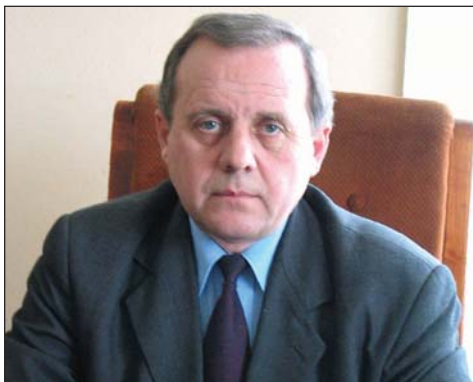
Martin BOTTESCH președintele Consiliului Județean Sibiu

Apariția unui ziar într-o localitate poate fi considerată un lux sau o necesitate. Indiferent de modul de interpretare, evenimentul poate fi un lucru bun, cu condiția transmiterii unor informații utile și corecte către cititori, care să schimbe în bine aspectul urbanistic și pe cel educativ în localitate. Felicitări la apariția primului număr și așteptăm să citim numai lucruri folositoare în ziarul „InfoSadu”.