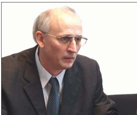
senatorul Nicolae NEAGU, președintele PD Sibiu

A fi informat este o obligație, mai ales în noul context în care se află România după 1 ianuarie 2007. De aceea, apariția publicației informative „InfoSadu” este bine venită și transmit felicitări celor care au avut această inițiativă. Cu siguranță că cei mai câștigați sunt sădenii, care vor avea prilejul să afle amănunte despre activitatea primăriei și a consiliului local, despre oportunitățile de finanțare a unor proiecte din fonduri europene, etc. Aștept cu interes fiecare număr din „InfoSadu” și sper ca, de fiecare dată, conținutul său să fie unul bogat și util pentru cititori.