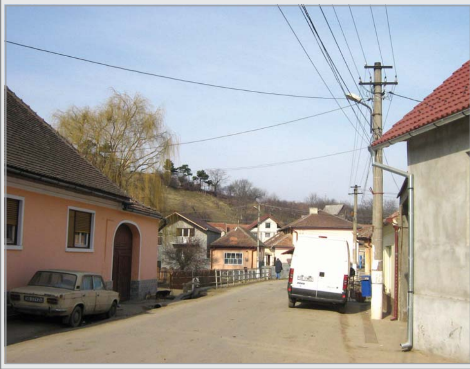
Școala "Samuil MICU" Sadu

Toți comercianții de pe raza comunei Sadu care desfășoară produse alimentare, sunt obligați să respecte cu maximă strictețe toate normele privind siguranța alimentelor și termenul de valabilitate al produsului.