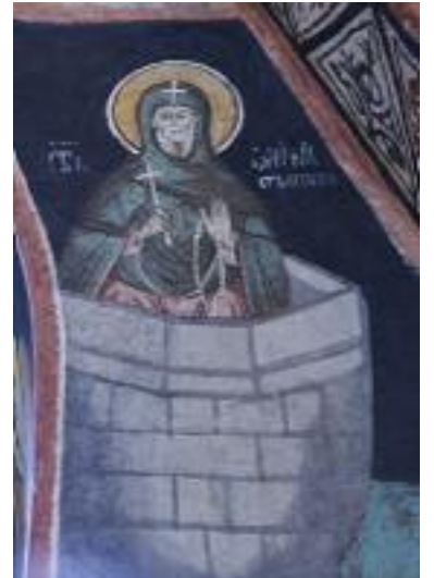
Sf. Simion Stâlpnicul

De cum pătrunzi în interiorul bisericii, pictura e cea care îți atrage atenția: e lucrată cu mihală, în stil miniatural, la fel ca în icoane. Iar din ansamblul pictural câteva icoane sunt de mare interes, mai ales că astfel de imagini sunt rare în bisericile din Sibiu. Sunt imaginile sfinților care își duc viața cocoțați pe stâlpi, de unde nu coboară niciodată, iar în Biserica de dinsus a sădenilor, e înfățișat Sf. Simion Stâlpnicul. E sfântul care și-a petrecut ani buni din viață sus pe un stâlp, înalt de 40 de coți. Nu putea nici să se așeze, nici să se culce, ci doar să se rezeme de îngrăditura pe care o făcuse în jurul stâlpului. Și tot în interiorul bisericii se mai spune una dintre poveștile lăcașului: cea a pintenilor din vremea lui Matei Corvinul, pinteni care se văd în arcadă. "În secolul trecut, când s-au făcut lucrări de reabilitare, s-a găsit arca de vechii biserici, s-au găsit pinteni din vremea lui Matei Corvin. De asemenea, avem monede vechi,