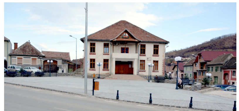
Primăria a achiziționat costume populare noi, produse de câștigătorul licitației S.C. Metropolis Com SRL